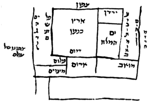
מפה מס' 2: מפת ארץ ישראל מאת רש"י כתב יד לייפציג 1