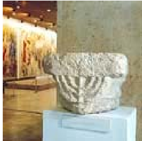
כותרת אבן הנושאת תבליט מנורה. מאות ד'-ה' לסה"נ.*